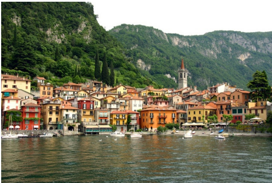
Fig. 1 Gezicht op Varenna

Toen het bericht naar buiten kwam stak er onmiddellijk een storm van verontwaardiging op en beklommen de milieugroepen de barricaden. De afdeling Lecco van de landelijke milieubeweging FAI heeft direct protest aangetekend en heeft binnen enkele uren een protestbrief gestuurd aan de president van de republiek, Giorgio Napolitano, aan de minister voor milieuzaken en de gouverneur van Lombardije. Men maakt zich niet alleen zorgen over de aantasting van de kust en het milieu, maar ook over de speculaties in de bouw die de schoonheid van Varenna onherstelbaar zullen beschadigen.