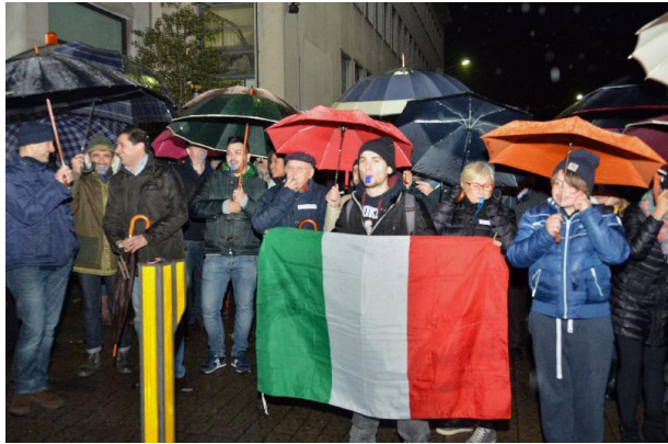
Fig. 2 Demonstratie in de regen op 3 maart

van de gebieden met parkeerbeperkingen. Op o.a. piazza Volta en piazza Roma verdwijnen de vrije parkeerplaatsen, soms geheel, soms worden het parkeerplaatsen voor omwonenden. De winkeliers hebben al verschillende demonstratieve optochten gehouden omdat ze vrezen hun klanten kwijt te raken. Ook is er een handtekeningenactie in gang gezet. De burgemeester is echter onverzettelijk, hij wil de proef in ieder geval een half jaar voortzetten. Ook is in enkele straten bij het piazza Volta nog slechts éénrichtingverkeer toegestaan. Het parkeren in het centrum zal er in ieder geval niet eenvoudiger op worden.